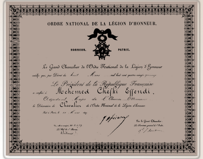
Légion d'honneur Nişanı / The Highest French Order of merit