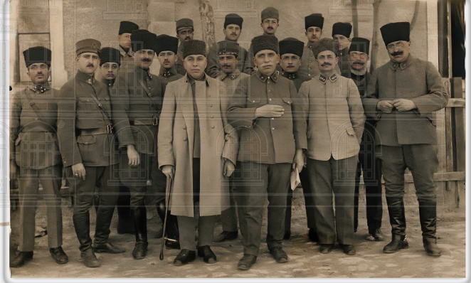
Harita Subaylarıyla İzmir'e Hareket Etmeden Önce, Ankara Gari, 1923 Before departing to İzmir with Mapping Officers, Ankara Train Station, 1923

2 Mayıs 1925 gün ve 657 sayılı Kanunla kurulan Harita Genel Müdürlüğü'nün başına getirilmiştir.