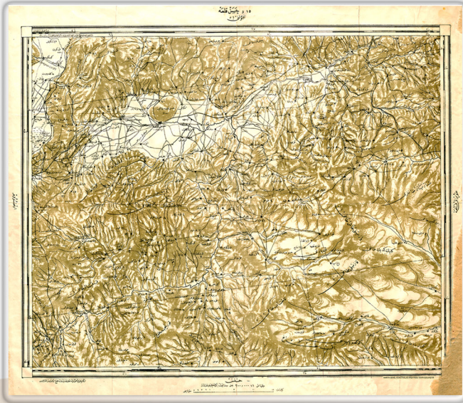
Hasankale Haritası, Harita Komisyonunun Yaptığı İlk 1/200.000 Ölçekli Harita, 1911

During this assignment, he was promoted to Brigadier General on April 26, 1912.