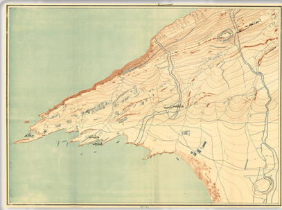
Çanakkale Tahkimat Haritası, 7 Numaralı Pafta Çanakkale Fortification Map, Sheet Number 7

Genelkurmay Harita Şubesi'nin, 28 Ekim 1918'de Savunma Bakanlığı'na bağlı Harita Dairesi haline getirilmesiyle dairenin başkanlığına atanmıştır.