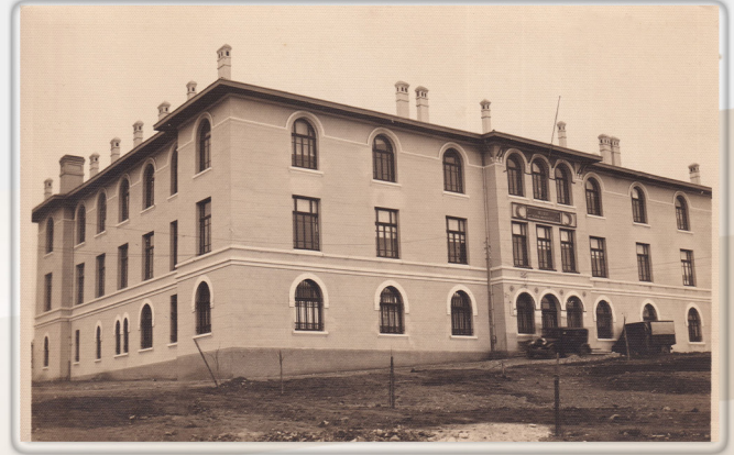
1930'lu Yıllar 1930s