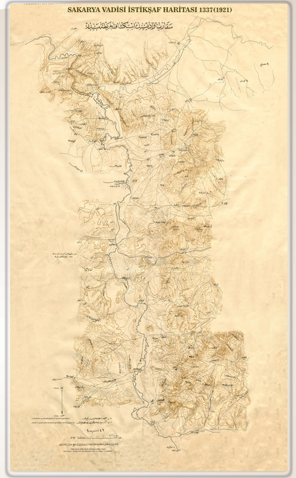
Sakarya Vadisi İstikşaf Haritası Sakarya Valley Reconnaissance Map

It took 20 days to carry out fieldwork and to finish the map. The map was printed and sent to the front during the days when the war kept going.