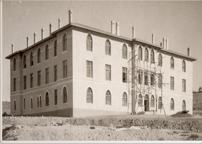
1926-1927 Yıllar / İnşaat Aşaması 1926-1927 / Construction Stage

In 1921, a location was searched for Mapping Department that moved from Istanbul to Ankara, and two single-story barracks located between today's Dikimevi and the current headquarter of the Directorate-General for Mapping were chosen. A vast area extending to Cebeci Hill was seen as the most suitable settlement area for headquarter of the Directorate-General for Mapping. A tender was held for the construction of the building planned to be located near the existing barracks in Cebeci and construction began in 1926.