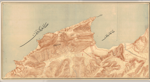
Çanakkale Tahkimat Haritası, 1 Numaralı Pafta Çanakkale Fortification Map, Sheet Number 1