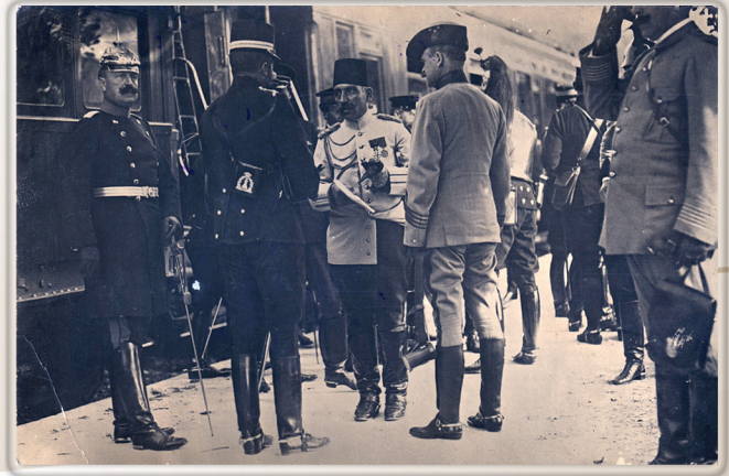
Fransa Manevrelarında, 1907 / French Maneuvers, 1907

The New Map Committee decided to start production of 1/25,000 scale maps in the neighborhood of Bakırköy. The first 1/25,000 scale map was produced in 1910.