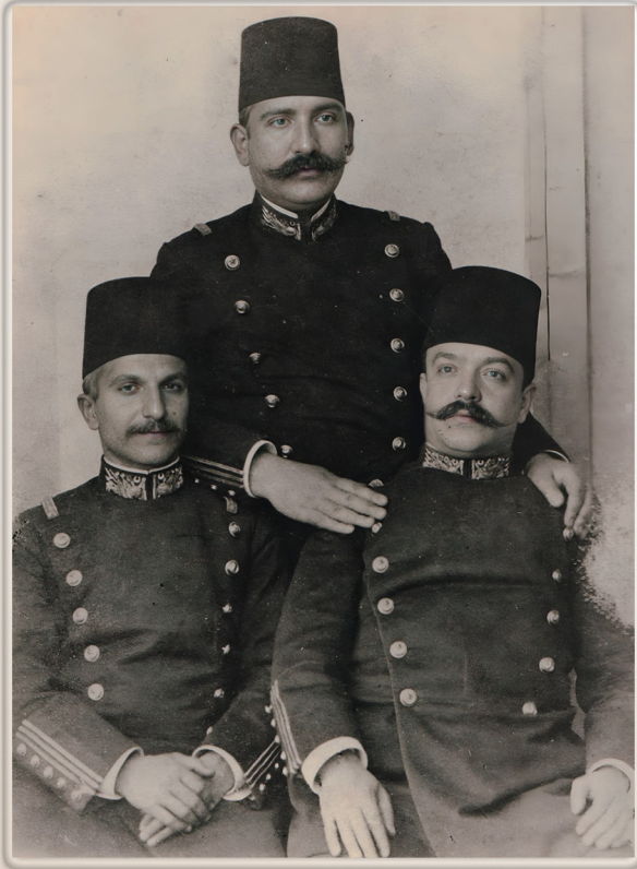
Fransa Yıllarından Bir Hatıra Fotoğrafi A Photograph from France

27 Temmuz 1894 tarihinde Paris'ten ayrılarak İstanbul'a dönmüştür. İstanbul'daki Topçu Okulu'na öğretmen olarak atanmış, burada ikinci sınıf öğrencilerine eğitim vermiştir.