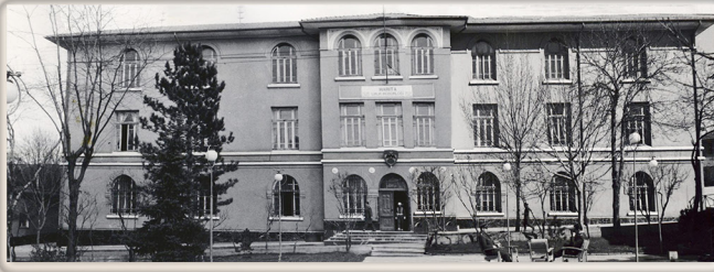
1960'lı Yıllar 1960s

The exterior plaster and paint of the building was renewed in 1956 and over the following years, it underwent several painting and minor repairs. In 2019, all the exterior plaster of the building was stripped, reapplied and repainted while the window and door frames were replaced to match with the original design.