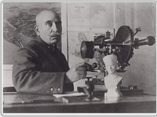
Mehmet Şevki Paşa Çalışma Ofisinde At Office

Millî Savunma Bakanı Orgeneral Fevzi Paşa tarafından 11 Temmuz 1921 tarihli bir telgrafla Millî Savunma Bakanlığı bünyesinde kurulan Harita Dairesi'nin başına geçmek üzere Ankara'ya davet edilmiş ve 17 Aralık 1921 tarihinde bu görevine başlamıştır.