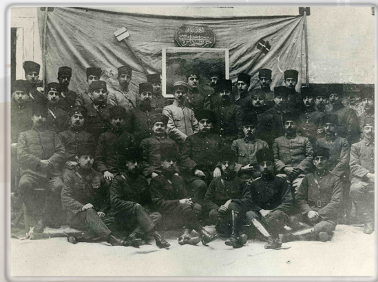
Harita Dairesi Subayları ile Birlikte, Ankara Together with officers of Mapping Department, Ankara