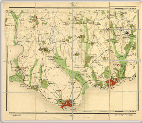
Bakırköy Haritası,1910 / Map of Bakırköy, 1910

Albay Mehmet Şevki, yeni bir Harita Heyeti kurulması için 11 Kasım 1908 tarihinde Genelkurmay Başkanlığı'na bir rapor sunmuş ve sunduğu rapor kabul edilerek, 09 Ağustos 1909 tarihinde Genelkurmay bünyesinde yeni bir Harita Komisyonu kurulmuş, kendisi de Jeodezi Birimine atanmıştır.