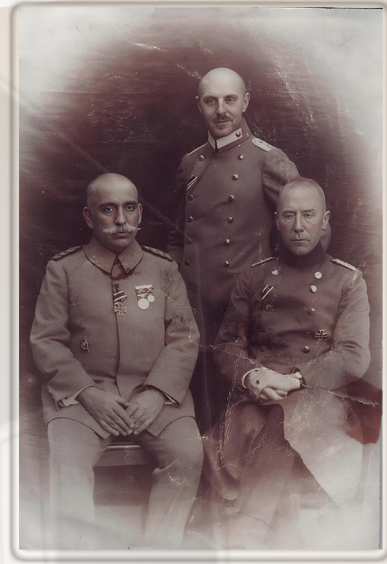
Mehmet Şevki Paşa'nın Alman Harita Dairesini Ziyareti Visit to German Mapping Department

With the outbreak of the Balkan War, Mehmet Şevki Pasha was appointed as the acting Chief of Mapping Branch of the General Staff. He was assigned to this position officially on February 10, 1915.