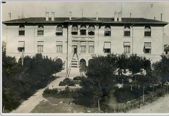
Harita Umum Müdürlüğü Directorate-General for Mapping