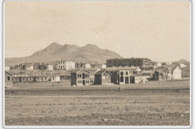
Cebeci Çayırılığında Bina İnşaatından Görünüm, 1926 View from the Building Construction in Cebeci Meadow, 1926

1956 yılında dış sıvası ve boyası yenilenmiş olan bina, sonraki yıllarda birçok kez boya ve küçük onarım görmüş, 2019 yılında binanın tüm dış cephe sıvası kazınıp yeniden sıvanmış ve boyanmış, pencere ve kapı doğramaları aslına uygun olarak değiştirilmiştir.