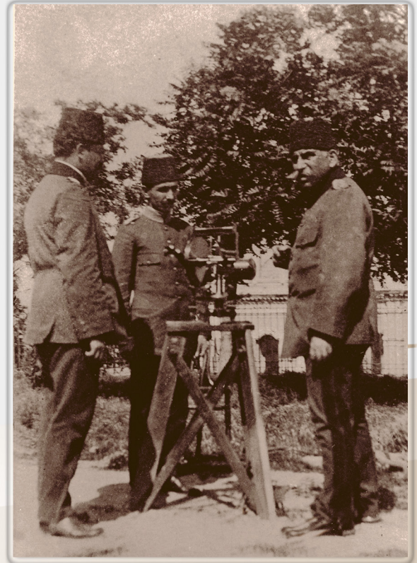
Harita Şubesi Müdürü, 1914 / Chief of Mapping Branch, 1914

Hasankale Map, first 1/200,000 scale map produced by Mapping Committee, 1911